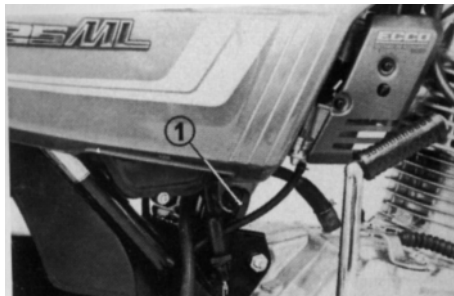
(1) Chave de ignição

Sua concessionária HONDA poderá determinar os intervalos corretos para esse serviço de acordo com suas condições particulares de uso.